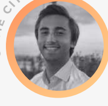
Président FOREVER YOUNG

14H30 // TABLE RONDE : DE LA CONCEPTION À LA FIN DE VIE DES PRODUITS : LES OPPORTUNITÉS DE L'INTELLIGENCE ARTIFICIELLE SUR LA CHAÎNE DE VALEUR DES TEXTILES ET CHAUSSURES