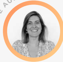
Directrice conseil (RE)SET