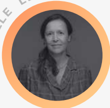
Co-fondatrice PARIS GOOD FASHION