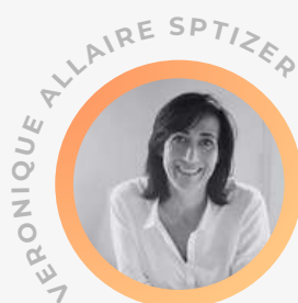
Directrice Perma-Circularité REFASHION

16H45 // KEYNOTE DE CLOTÛRE : QUELS PROGRÈS ET DÉFIS POUR LA FILIÈRE DE RECYCLAGE TEXTILE ET CHAUSSURE FRANCE/EUROPE ?